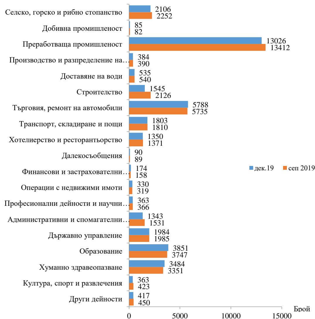
Фиг. 1. Наети лица по трудово и служебно правоотношение в област Сливен към края на септември 2019 и декември 2019 година

Спрямо края на третото тримесечие на 2019 г. наетите лица в общественния сектор се увеличават с 0.6% (достигат до 11.0 хил.), а в частния сектор намаляват с 4.1% (достигат до 28.0 хил.).