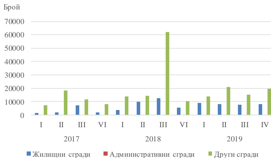
Фиг. 2. Издадени разрешителни за строеж в област Плевен – разгърната застроена площ по видове сгради и тримесечия

Най-голям брой разрешителни за строеж на нови жилищни сгради са издадени в областите София (столица) - 243, Пловдив - 261, София - 139, Варна - 137, и Бургас - 133. Най-много жилища предстои да бъдат започнати в областите София (столица) - 2 515, Варна - 1 532, Пловдив - 968, Бургас - 547, и Кърджали - 324.