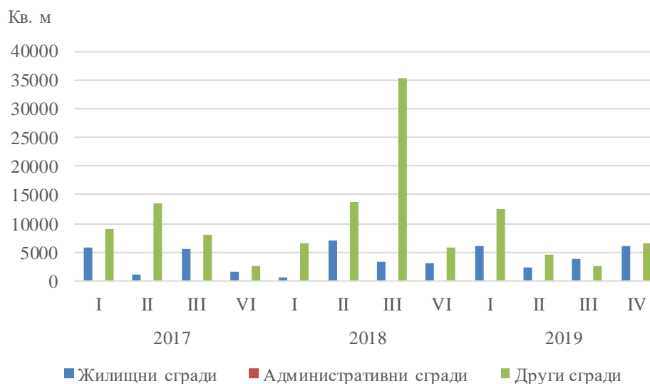
Фиг. 4. Започнато строителство на нови сгради в област Плевен – разгърната застроена площ по видове сгради и тримесечия

Строителство на най-голям брой нови сгради е започнало в областите: Пловдив - 194 жилищни и 65 други сгради; София (столица) - 177 жилищни и 29 други сгради; Варна - 102 жилищни и 32 други сгради; Бургас - 92 жилищни и 39 други сгради; София - 75 жилищни и 35 други сгради; Стара Загора - 53 жилищни и 58 други сгради.