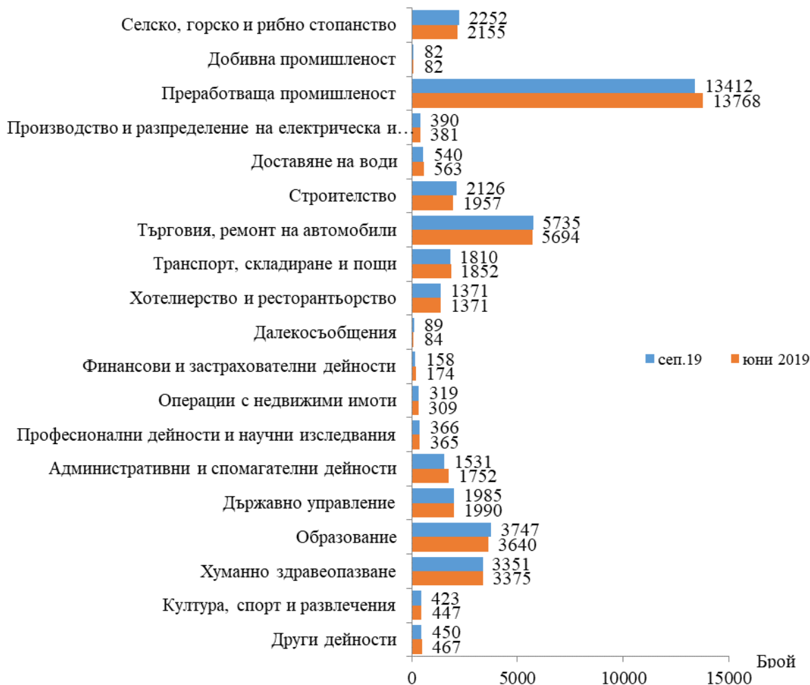
Фиг. 1. Наети лица по трудово и служебно правоотношение в област Сливен към края на юни 2019 и септември 2019 година

В края на септември 2019 г. наетите лица по трудово и служебно правоотношение в област Сливен са с 6.6% повече в сравнение със същия период на предходната година, като в обществения сектор наетите по трудово и служебно правоотношение се увеличават с 1.0%, а в частния сектор съответно с 8.9%.