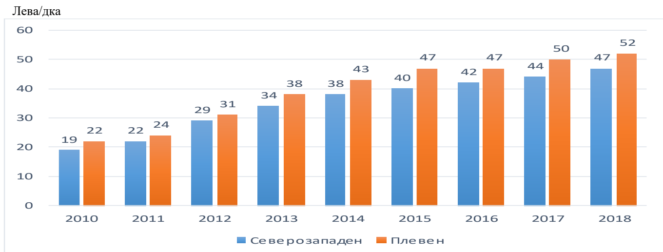
Фиг. 2. Средни цени за наем/аренда на земеделска земя в Северозападния район и област Плевен за периода 2010 - 2018 година