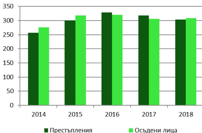
Фиг. 1. Престъпления, завършили с осъждане и осъдени лица в област Смолян през периода 2014 - 2018 година

Обвиняемите лица в област Смолян през 2018 г. са 396. От тях с ефективна осъдителна присъда са приключили делата на 95 лица или 24.0% от общия брой на обвиняемите, на 213 лица - с условно осъждане (53.8%), 79 лица са освободени от наказание (19.9%), а 9 лица са оправдани (2.3%). Няма лица с прекратени дела.