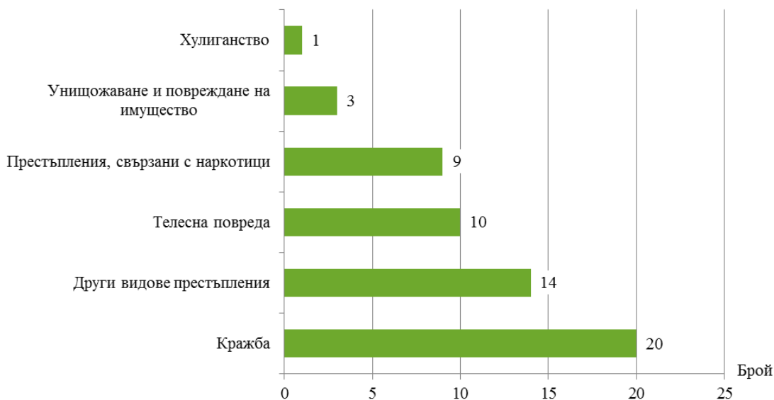
Фиг. 2. Малолетни и непълнолетни, извършители на престъпления, по видове престъпления в област Кюстендил през 2018 година

От общия брой на лицата на възраст от 8 до 17 години 17.5% са регистрирани в ДПС за нанесени телесни повреди и 15.8% - за престъпления, свързани с наркотици (Фиг. 2).