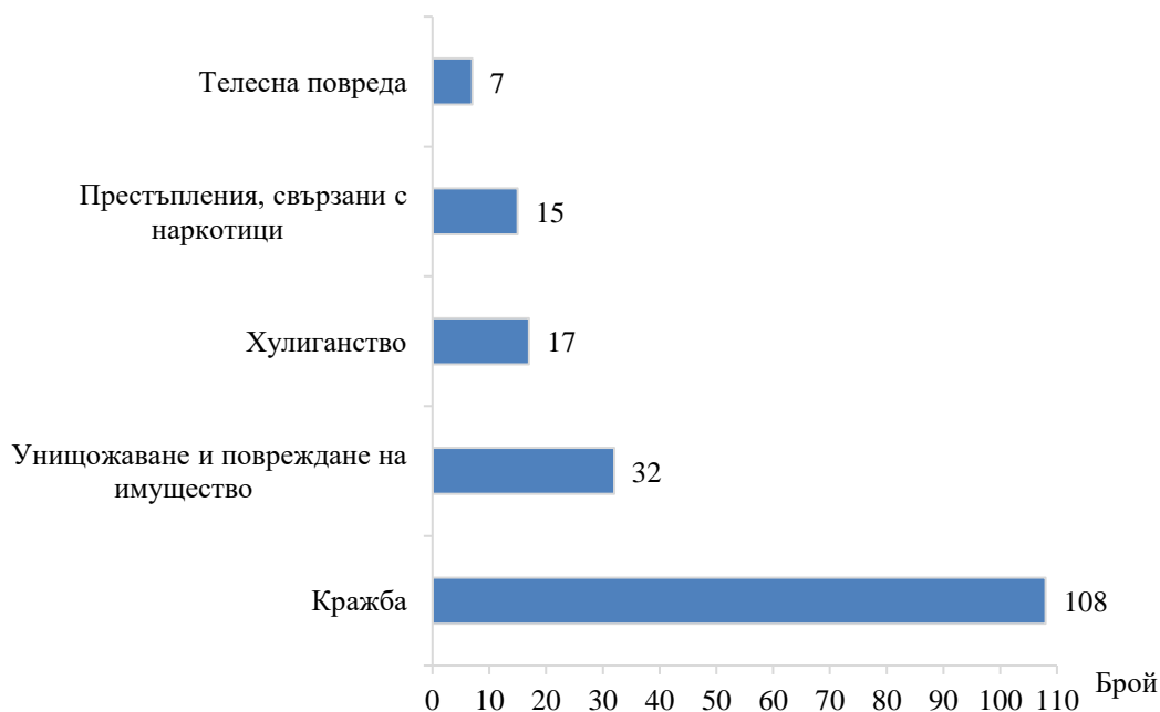
Фиг. 2. Малолетни и непълнолетни, извършители на престъпления по някои видове престъпления в Софийска област през 2018 година

всички лица, водени на отчет в ДПС за извършени престъпления. Най-висок е дялът на извършителите на кражби от магазини или други търговски обекти – 33.3% (36 лица) и на кражби от домовете - 21.3% (23 лица).