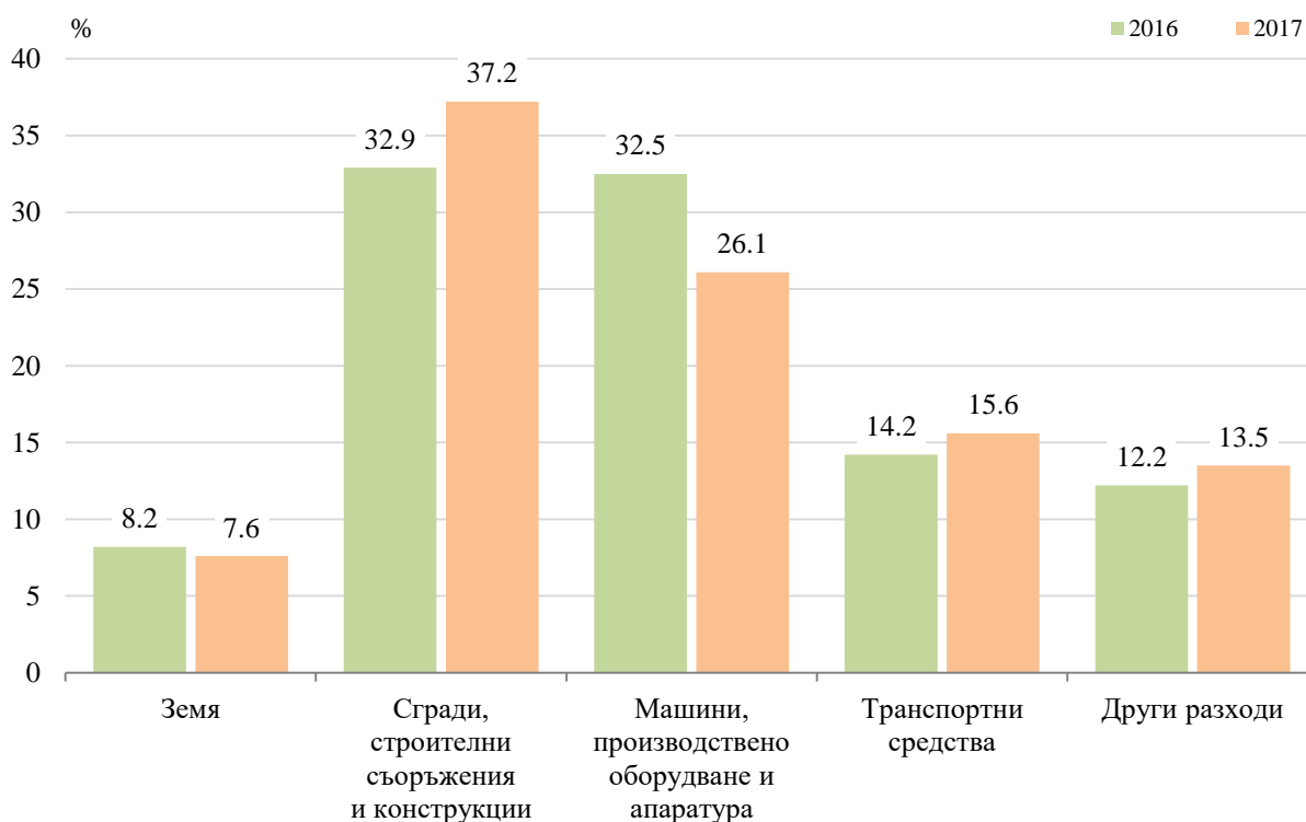
Фиг. 2. Структура на разходите за придобиване на дълготрайни материални активи през 2016 и 2017 г. в област София (столица) по видове

През 2015 г. е регистрирана промяна в структурата на извършените разходи за придобиване на дълготрайни материални активи в областта по видове. Относителният дял на направените инвестиции за машини, производствено оборудване и апаратура намалява с 6.4 пункта в сравнение с предходната година и достига 26.1%. Спрямо 2016 г. се увеличават вложените средства за придобиване на сгради, строителни съоръжения и конструкции с 4.3 пункта, които формират 37.2% от общия обем инвестиции в ДМА.