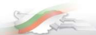
Фиг. 2. Пренощували лица по категории на местата за настаняване в област Кърджали