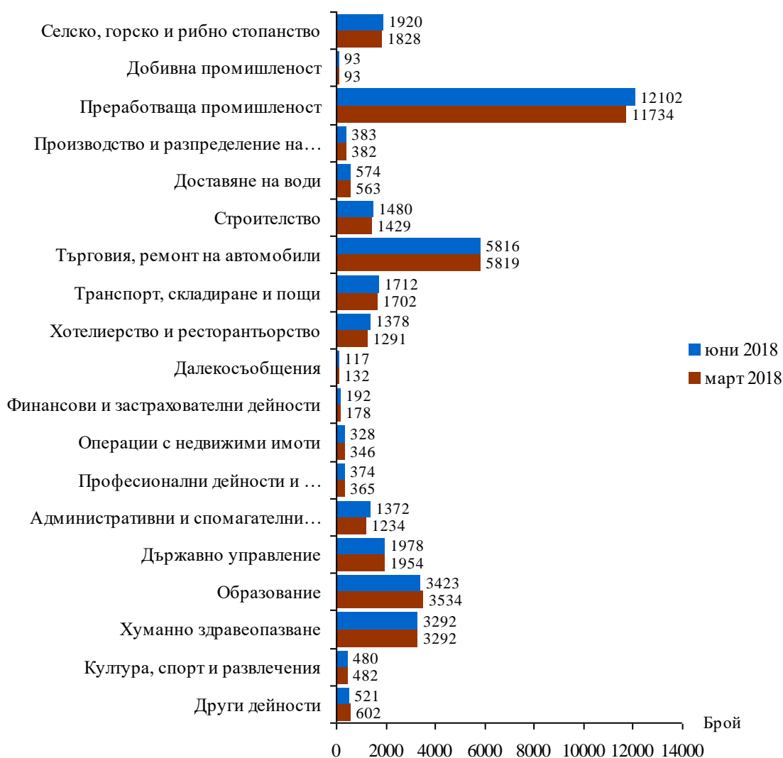
Фиг. 1. Наети лица по трудово и служебно правоотношение в област Сливен към края на март 2018 и юни 2018 година

Спрямо края на първото тримесечие на 2018г. наетите лица в общественния сектор се увеличават с 1.4% (достигат до 10.6 хил.), а в частния сектор се увеличават с 1.6% (достигат до 26.9 хил.).