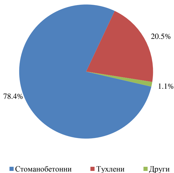
Фиг. 1. Въведени в експлоатация новопостроени жилищни сгради в област Варна през второто тримесечие на 2018 г. по конструкция

Област Варна е на второ място в страната по въведени в експлоатация жилищни сгради. Преди нея е област Пловдив - 91 сгради с 274 жилища.