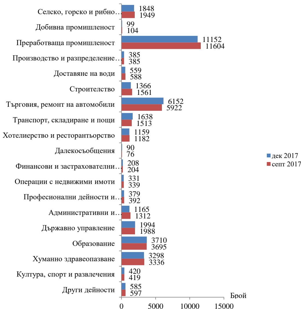
Фиг. 1. Наети лица по трудово и служебно правоотношение в област Сливен към края на септември 2017 и декември 2017 година

Спрямо края на третото тримесечие на 2017 г. наетите лица в общественения сектор намалява с 1.5% (достигат до 10.6 хил.), а в частния сектор намаляват с 1.8% (достигат до 25.9 хил.).