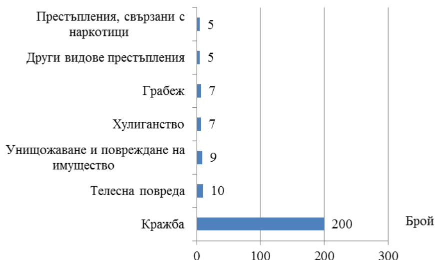
Фиг. 2. Малолетни и непълнолетни, извършители на престъпления, по някои видове престъпления през 2016 година

Пострадалите от престъпления малолетни и непълнолетни лица през 2016 г. са 65, от които 27, или 41.5% са момичета. Относителният дял на малолетните, пострадали от престъпления, е 47.7% (31лица), а на непълнолетните – 52.3%, или 34 лица. Най-големи са броят и дялът на малолетните и непълнолетните, пострадали от нанесени телесни повреди - 20 лица (30.8%) и грабежи - 5 лица (7.8%).