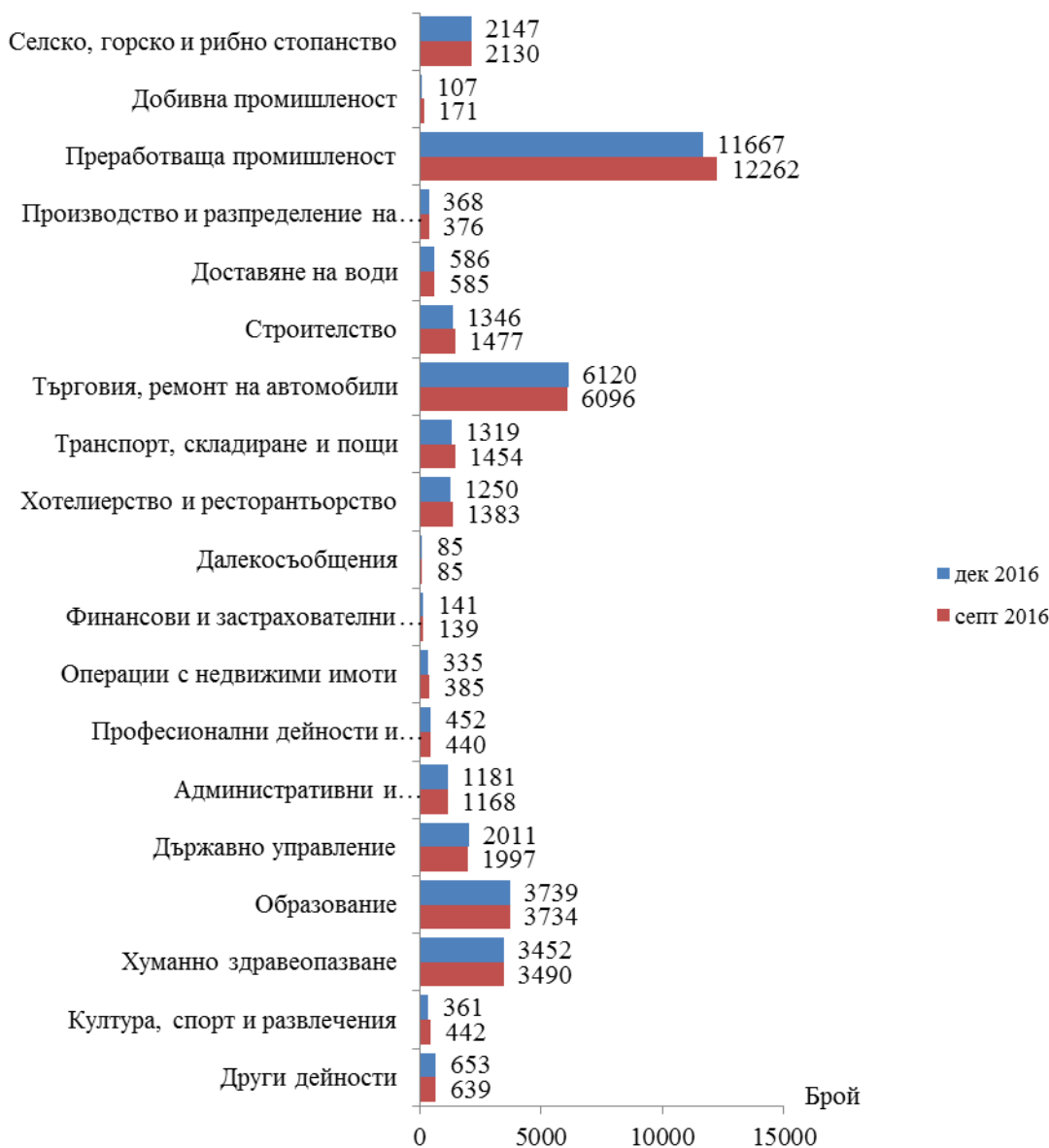
Фиг. 1. Наети лица по трудово и служебно правоотношение в област Сливен към края на септември 2016 и декември 2016 година

Спрямо края на третото тримесечие на 2016 г. наетите лица в общественения сектор намаляват с 0.5% (достигат до 10.7 хил.), а в частния сектор намаляват с 3.9% (достигат до 26.7 хил.).