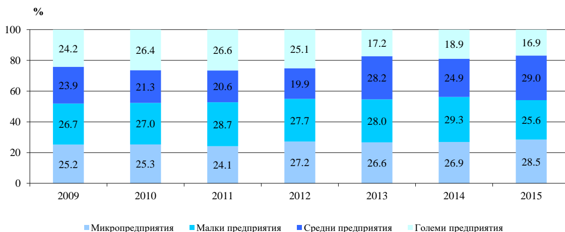
Фиг. 3. Относителен дял на дълготрайните материални активи към 31.12. в област Велико Търново по групи предприятия според броя на заетите в тях лица

Икономическите сектори с най-голяма стойност на ДМА са: