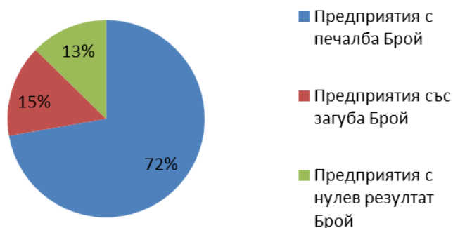
Фиг. 1. Структура на нефинансовите предприятия според крайния финансов резултат от дейността им през 2015 година

През 2015 г. броят на нефинансовите предприятия, реализирали печалба е 4 222, или 72.2%, със загуба приключват 881, или 15.1% и с нулев резултат 742, или 12.7% от всички предприятия в областта.