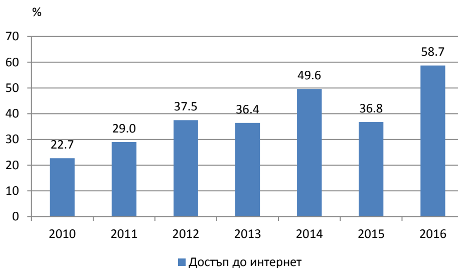
Фиг. 1. Относителен дял на домакинствата с достъп до интернет по години

Показателна е тенденцията на навлизането на новите технологии - за седемгодишен период относителният дял на домакинствата с достъп до интернет се е увеличил с 36.0 процентни пункта.