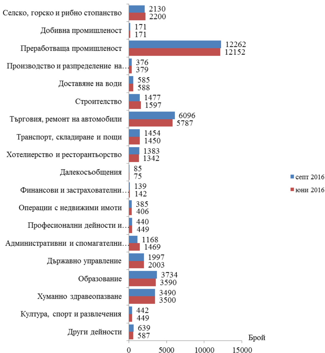
Фиг. 1. Наети лица по трудово и служебно правоотношение в област Сливен към края на юни 2016 и септември 2016 година

Спрямо края на второто тримесечие на 2016 г. наетите лица в общественния сектор намаляват с 1.0% (достигат до 10.7 хил.), а в частния сектор се увеличават с 0.8% (достигат до 27.7 хил.).