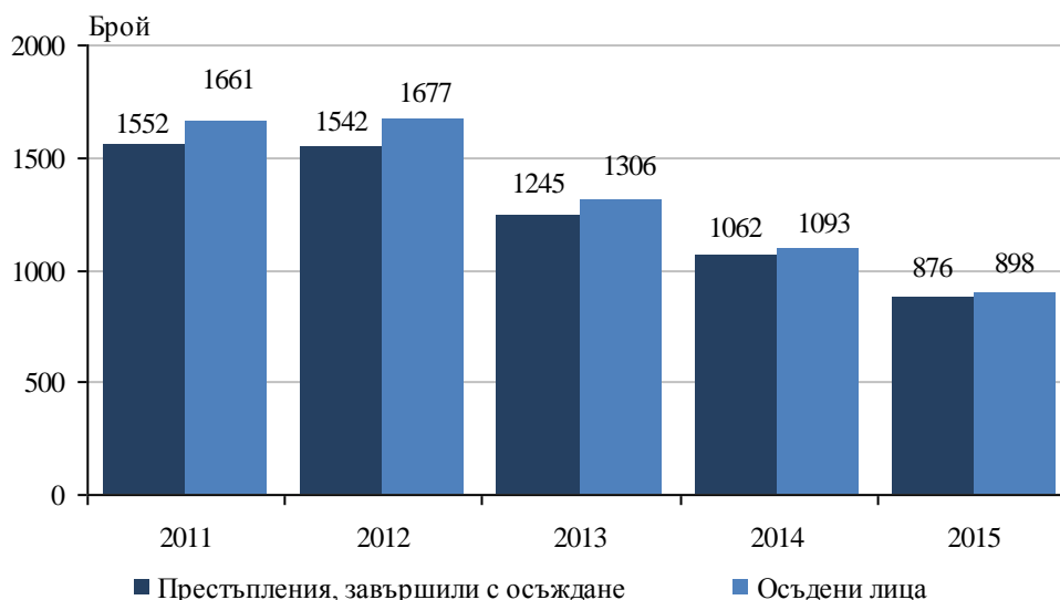
Фиг. 1. Престъпления, завършили с осъждане, и осъдени лица в област Велико Търново през периода 2011 - 2015 година