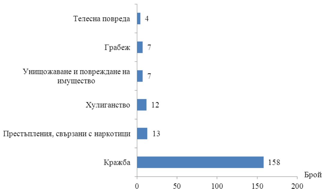
Фиг. 1. Малолетни и непълнолетни, извършители на престъпления в област Стара Загора по някои видове престъпления през 2015 година