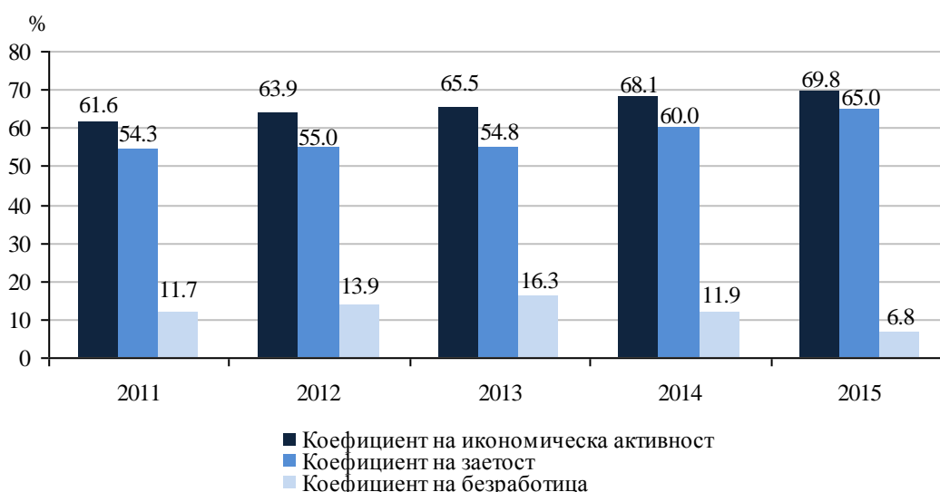
Фиг. 2. Коэффициенти на икономическа активност, заетост и безработица за лицата на 15 - 64 навършени години в област Велико Търново

Лицата извън работната сила във възрастовата група 15 - 64 навършени години през 2015 г. са 48.5 хил., от които 41.4% са мъже и 58.6% - жени.