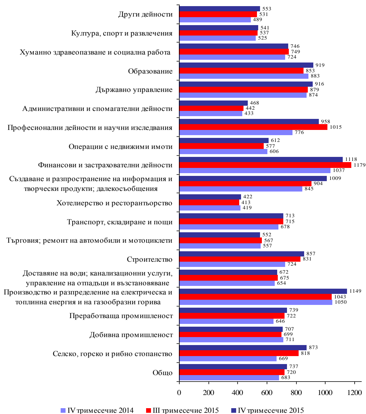
Фиг. 2. Средна месечна брутна работна заплата по икономически дейности в област Велико Търново (левове)

През четвъртото тримесечие на 2015 г. средната месечна работна заплата в областта нараства спрямо предходното тримесечие с 2.4% до 737 лв. (със 178 лв. по-ниска от средната за страната). В сравнение с останалите области в страната по равнище на работна заплата област Велико Търново се нарежда на 11 -то място.