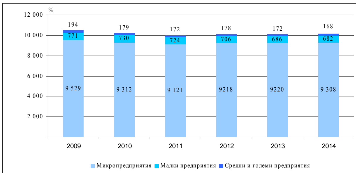
Фиг. 1. Нефинансови предприятия в област Велико Търново според броя на заетите в тях лица

Според финансовия резултат за 2014 г. 6 708 предприятия, или 66.1% от всички нефинансовите предприятия в областта, са реализирали печалба, 1 833 предприятия или 18.0% - загуба, а с нулев финансов резултат са приключили 1 617 предприятия, или 15.9%.