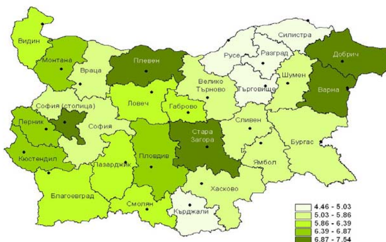
Фиг. 2 Осигуреност с общопрактикуващи лекари на 10 хил. души от населението през 2008 г. по области

В 10 области осигуреността е по-висока от показателя за страната. С най-висока осигуреност е област Плевен (7.5), София-столица (7.1), Добрич, Стара Загора и Варна (7.0). Осигуреността във Видин и Габрово е еднаква с тази за страната.