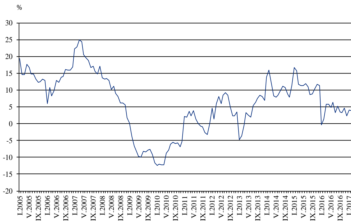
Фиг. 3. Изменение на оборота в раздел „Търговия на дребно, без търговията с автомобили и мотоциклети” спрямо съответния месец на предходната година (Календарно изгледени)

През февруари 2017 г. спрямо същия месец на 2016 г. оборотът нараства по-значително при: търговията на дребно чрез поръчки по пощата, телефона или интернет - с 26.5%, търговията на дребно с фармацевтични и медицински стоки - с 11.0%, търговията на дребно с компютърна и комуникационна техника - с 10.7%, и търговията на дребно с разнообразни стоки - с 10.0%. Намаление е регистрирано при търговията на дребно с автомобилни горива и смазочни материали - с 9.3%.