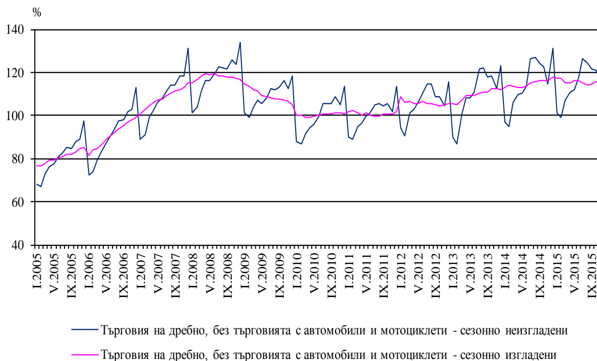
Фиг. 1. Индекси на оборота в раздел „Търговия на дребно, без търговията с автомобили и мотоциклети” (2010 = 100)

През ноември 2015 г. оборотът в търговията на дребно , изчислен въз основа на календарно изгладени 4 данни, нараства с 2.0% спрямо същия месец на предходната година.