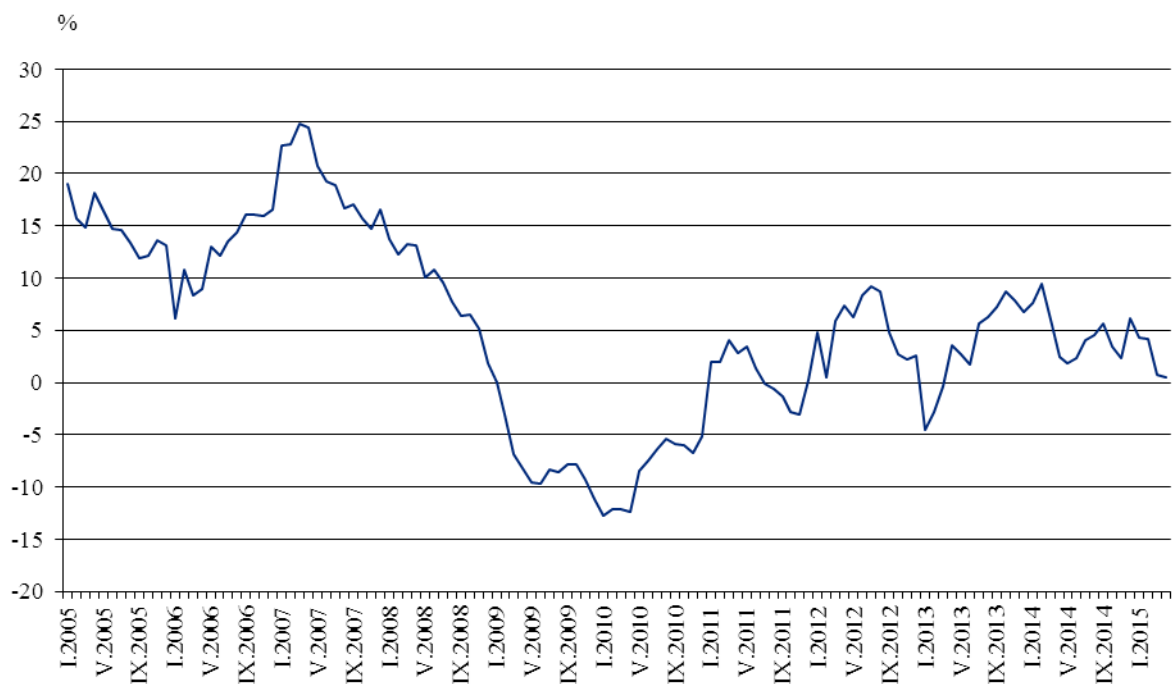
Фиг. 3. Изменение на оборота в раздел „Търговия на дребно, без търговията с автомобили и мотоциклети” спрямо съответния месец на предходната година (Календарно изгледени)

През април 2015 г. спрямо същия месец на 2014 г. оборотът нараства по-значително при: търговията на дребно чрез поръчки по пощата, телефона или интернет - със 7.7%, търговията на дребно с фармацевтични и медицински стоки - с 5.6%, търговията на дребно с автомобилни горива и смазочни материали - с 3.7%, търговията на дребно с битова техника, мебели и други стоки за бита - с 3.3%. Спад е регистриран в търговията на дребно с текстил, облекло, обувки и кожени изделия - с 4.5%, в търговията на дребно с компютърна и комуникационна техника - с 2.3%, и в търговията на дребно с хранителни стоки, напитки и тютюневи изделия - с 1.2%.