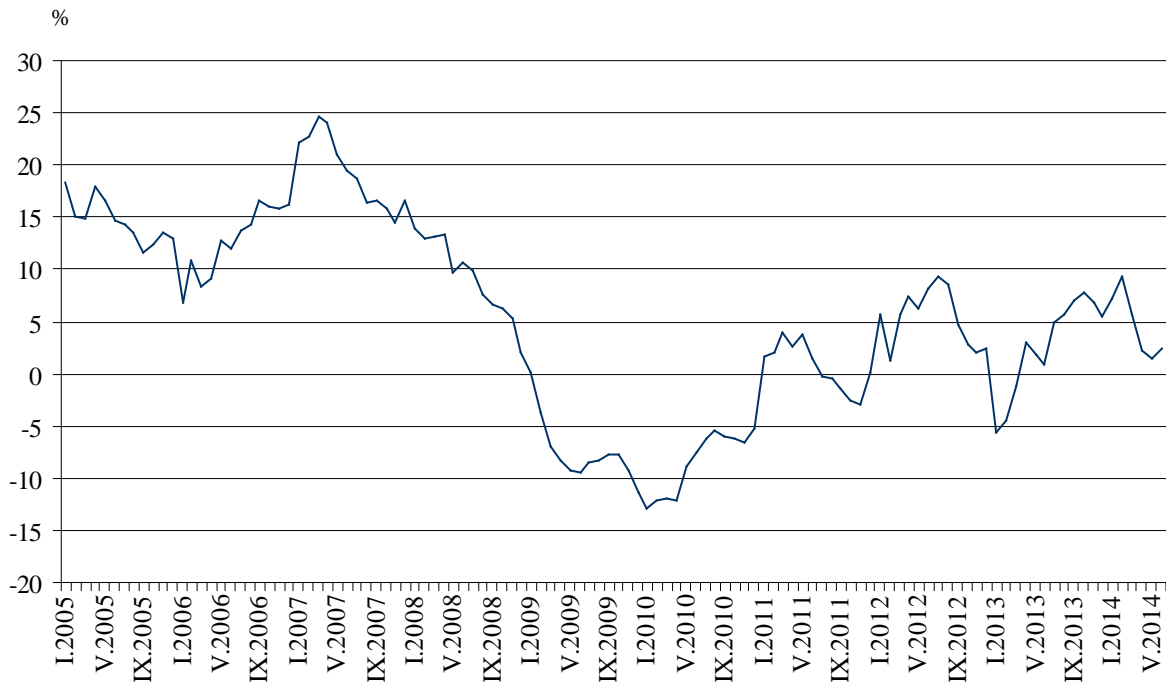
Фиг. 3. Изменение на оборота в раздел „Търговия на дребно, без търговията с автомобили и мотоциклети” спрямо съответния месец на предходната година (Календарно изгладени)

През юни 2014 г. спрямо същия месец на 2013 г. оборотът нараства по-значително в търговията на дребно чрез поръчки по пощата, телефона или интернет - с 23.4%, в търговията на дребно с хранителни стоки, напитки и тютюневи изделия - с 6.4%, и в търговията на дребно с текстил, облекло, обувки и кожени изделия - с 6.1%. Спад е регистриран в търговията на дребно с автомобилни горива и смазочни материали - с 5.0%.