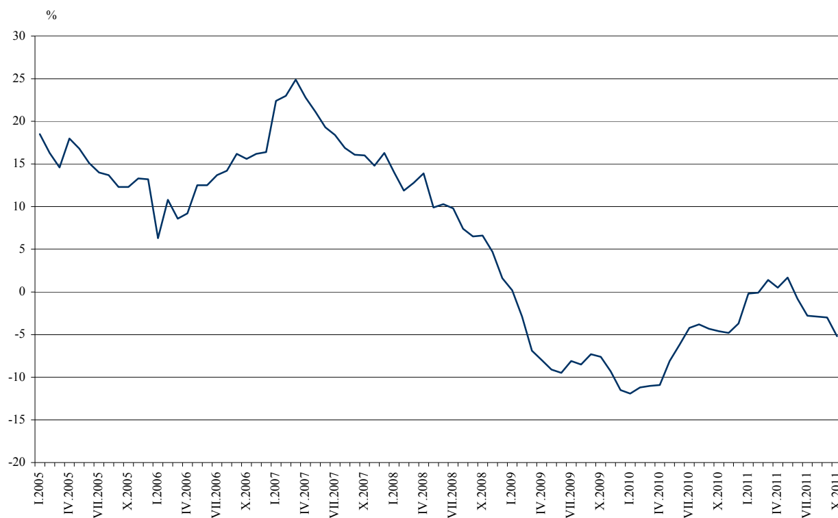
Фиг. 3. Процентно изменение на оборота в раздел „Търговия на дребно, без търговията с автомобили и мотоциклети” спрямо съответния месец на предходната година (Календарно изгледени)

Оборотът през октомври 2011 г. спрямо същия месец на 2010 г. бележи ръст в търговията на дребно с фармацевтични и медицински стоки с 6.3%. Спад е регистриран в търговията на дребно с битова техника, мебели и други стоки за бита с 10.5%, в търговията на дребно с компютърна и комуникационна техника - с 8.3%, в търговията на дребно с автомобилни горива и смазочни материали - с 6.9%, в търговията на дребно с текстил, облекло, обувки и кожени изделия - с 3.5%, и в търговията на дребно с храни, напитки и тютюневи изделия - с 1.9%.