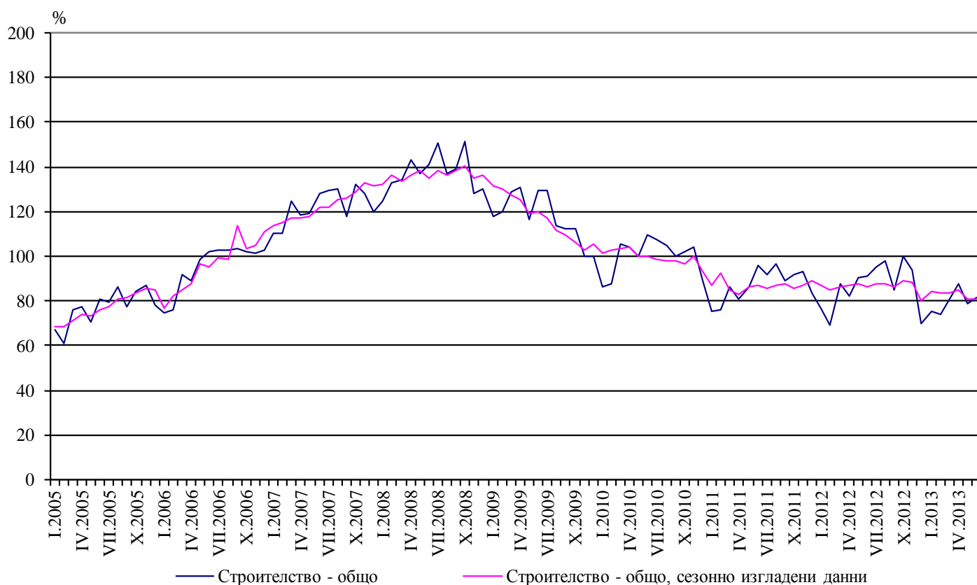
Фиг. 1. Индекси на строителната продукция (2010 = 100)

Календарно изгладените данни 4 показват намаление от 8.8% на строителната продукция през юни 2013 г. в сравнение със същия месец на 2012 година (табл. 4).