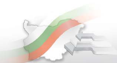
Фиг. 1. Разпределение на областите по равнище на бедност през 2010 година