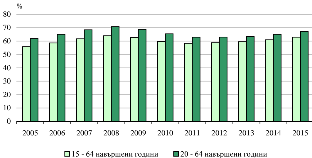
Фиг. 2. Коэффициенти на безработица по пол