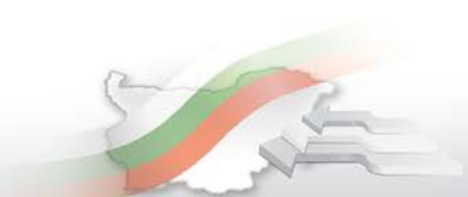
Фиг. 1. Коэффициенти на заетост по възрастови групи