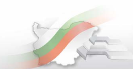
Фиг. 2. Обща полезна и жилищна площ на въведените в експлоатация новопостроени жилища