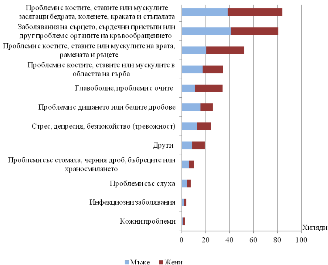
Фиг. 2. Лица със заболявания или здравни проблеми, причинени или усложнени от работата, по вид на заболяването (здравния проблем)

От лицата, имащи здравни проблеми, 79.0% не са отсъствали от работа през предходните 12 месеца поради основния си здравен проблем или са отсъствали за по-малко от един ден, а 12.3% считат, че не биха могли повече да работят поради основния си здравен проблем.