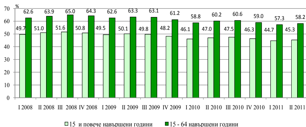
Фиг. 1. Коефициент на заетост по тримесечия

През второто тримесечие на 2011 г. 1 710.7 хил. от населението на възраст 15 - 64 навършени години са икономически неактивни (извън работната сила), а коефициентът на икономическа неактивност е 34.4%.