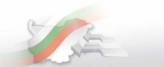
www.nsi.bg Индекс на разходите на работодателите за труд за периода четвърто тримесечие на 2008 - четвърто тримесечие на 2010 година (Календарно изгладени)