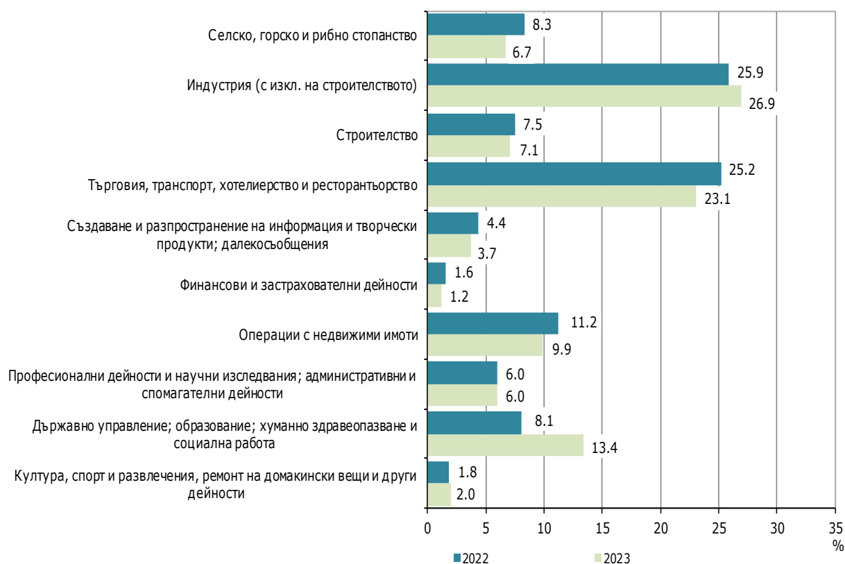
Фиг. 2. Структура на разходите за придобиване на дълготрайни материални активи през 2022 и 2023 г. по икономически дейности

През отчетната годината е регистрирана промяна и в структурата на разходите за придобиване на дълготрайни материални активи по видове. Относителният дял на направените инвестиции за сгради, строителни съоръжения и конструкции нараства с 2.1 процентни пункта в сравнение с предходната година и достига 36.8%. Нарастват и инвестициите за машини, производствено оборудване и апаратура с 0.3 процентни пункта, като формират съответно 28.4% от общия обем инвестиции в ДМА. Същевременно се наблюдава спад на инвестициите при закупуването на земя и други разходи с по 1.2 процентни пункта и достигат съответно 7.1 и 14.0%, докато при транспортните средства няма промяна спрямо предходната година.