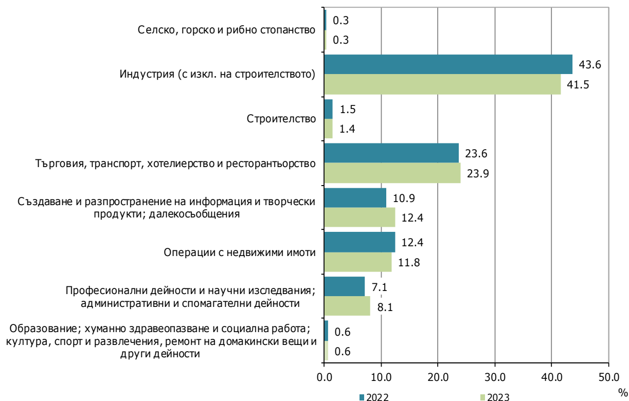
Фиг. 1. Структура на преките чуждестранни инвестиции в предприятията от нефинансовия сектор по икономически дейности към 31.12.