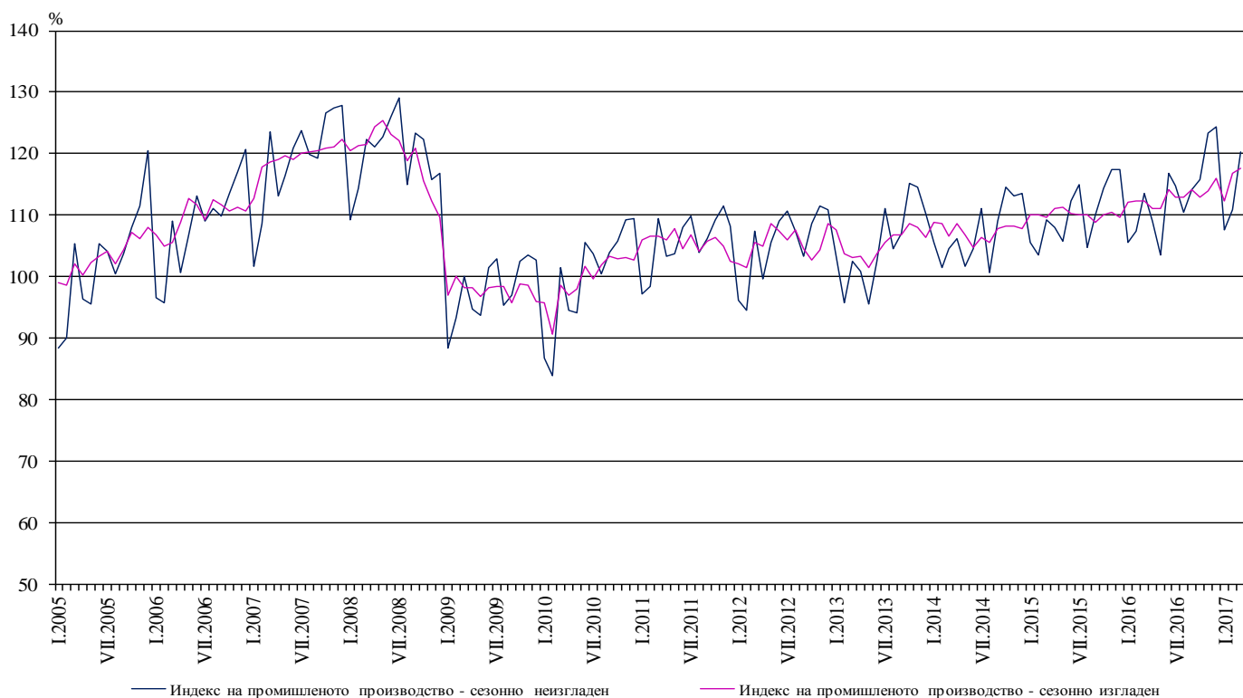
Фиг. 1. Индекси на промишленото производство (2010 = 100)

През март 2017 г. при календарно изгладения индекс 4 на промишленото производство е регистриран ръст от 5.9% спрямо съответния месец на 2016 година.