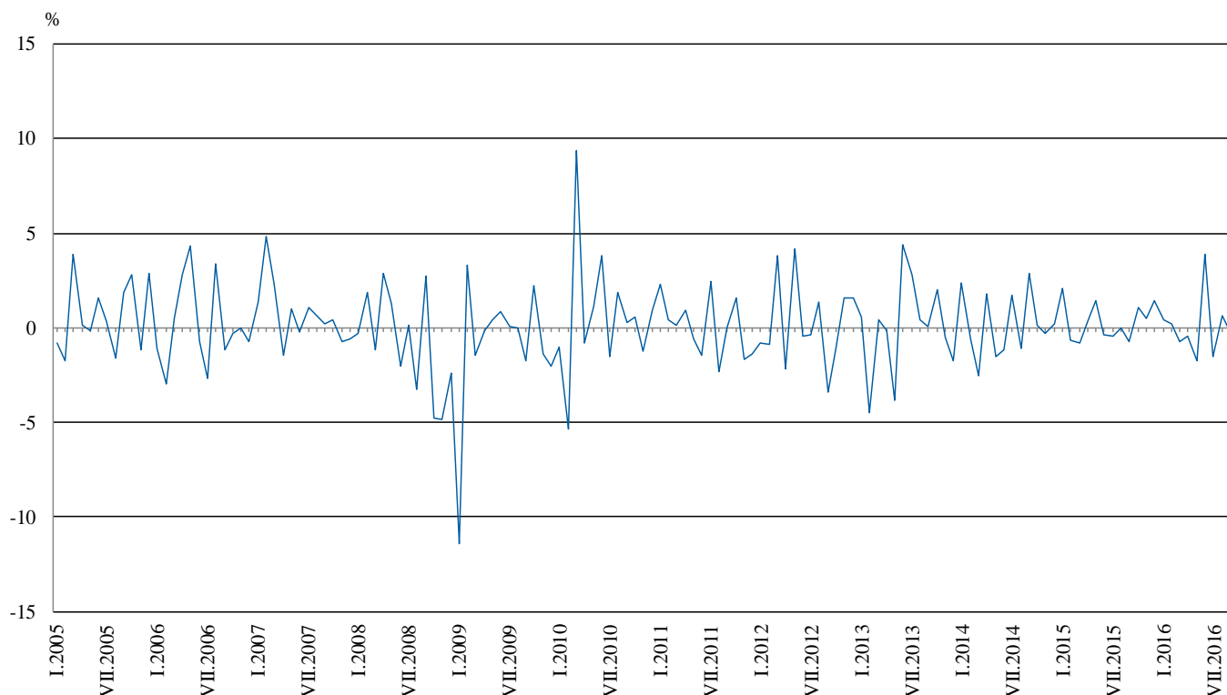
Фиг. 2. Изменение на индекса на промишленото производство спрямо предходния месец (Сезонно изгладени)

По-значителен ръст в преработващата промишленост се наблюдава при: ремонта и инсталирането на машини и оборудване - с 15.4%, обработката на кожи; производството на обувки и други изделия от обработени кожи без косъм - с 13.6%, производството на метални изделия, без машини и оборудване - с 13.0%, производството на облекло - с 6.3%. Спад е регистриран при: производството на превозни средства, без автомобили - с 15.1%, производството на тютюневи изделия - с 11.3%, производството на дървен материал и изделия от него, без мебели - със 7.1%, производството на автомобили, ремаркета и полуремаркета - с 6.6%.