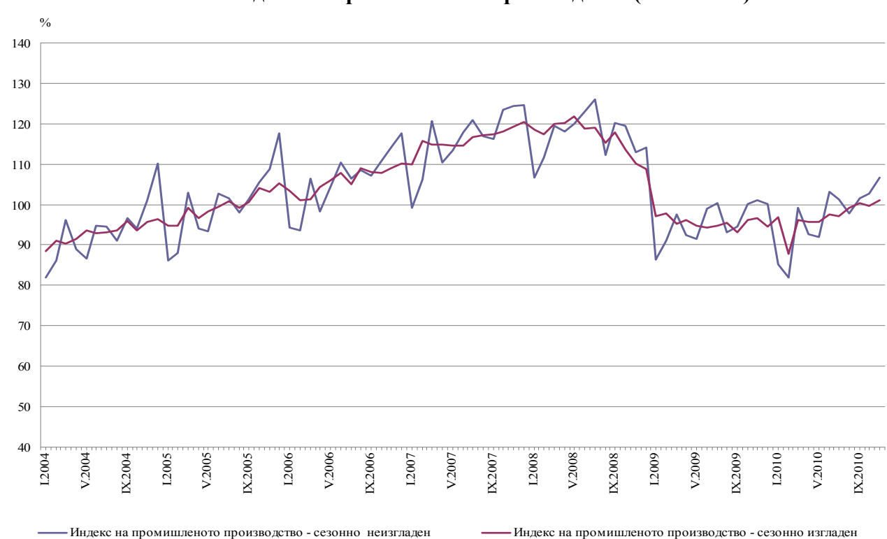
Фиг. 1. Индекс на промишленото производство (2005 = 100)

През ноември 2010 г. календарно изгладеният индекс<sup>4</sup> на промишленото производство нараства с 5.6% спрямо съответния месец на 2009 година.