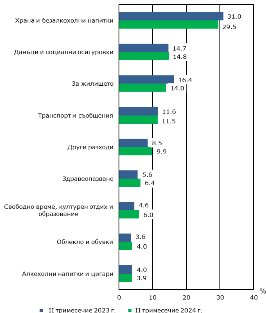
Фиг. 2. Структура на общия разход на домакинство през второто тримесечие на 2023 и 2024 година

В структурата на общия разход с най-голям относителен дял са разходите за храна и безалкохолни напитки (29.5%), следвани от разходите за данъци и социални осигуровки (14.8%), за жилище (14.0%), и за транспорт и съобщения (11.5%).