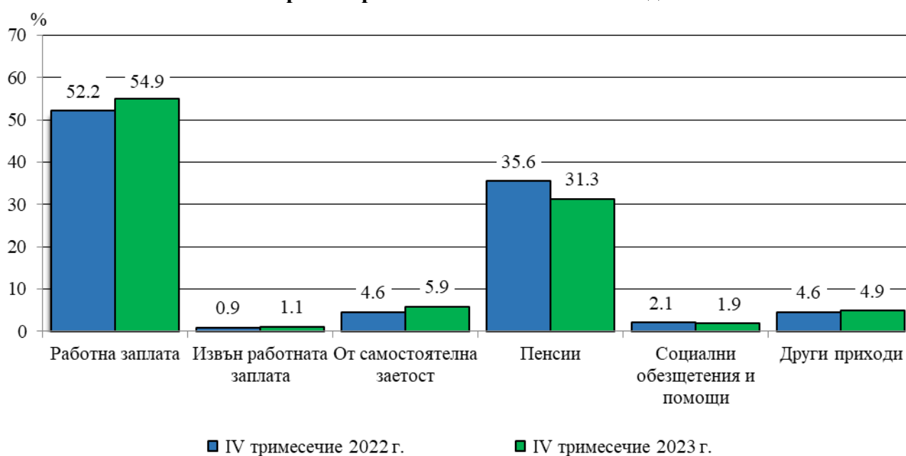
Фиг. 1. Структура на общия доход на домакинство през четвъртото тримесечие на 2022 и 2023 година

В номинално изражение през четвъртото тримесечие на 2023 г. в сравнение със същото тримесечие на 2022 г. доходите средно на лице от домакинство по източници на доход се променят, както следва: