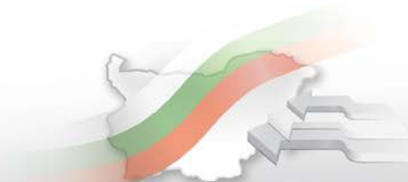
Таблица 4 Износ, внос и търговско салдо на България по сектори на Стандартната външотърговска класификация (SITC, рев. 4) през периода януари - ноември 2013 и 2014 1 година