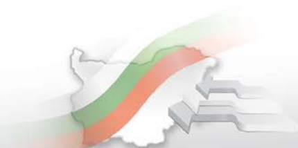
Фиг. 1. Производство и доставки на твърди горива