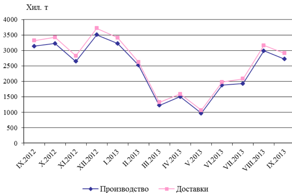
Фиг. 2. Производство и доставки на пропан-бутан