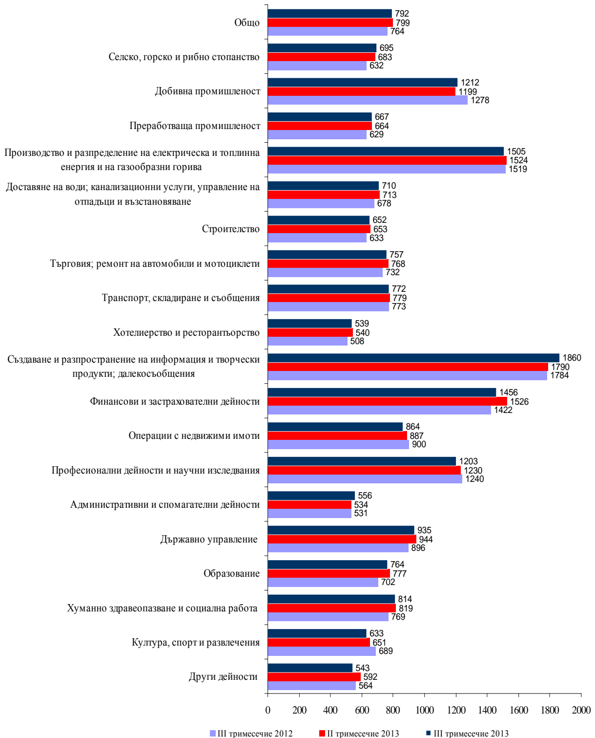
Фиг. 2. Средна брутна месечна работна заплата по икономически дейности (левовете)

През третото тримесечие на 2013 г. средната месечна работна заплата намалява спрямо второто тримесечие на 2013 г. с 0.9% до 792 лева. Икономическите дейности, в които е регистрирано най-голямо намаление на средната месечна работна заплата, са: „Други дейности” - с 8.3%, и „Финансови и застрахователни дейности” - с 4.6%.