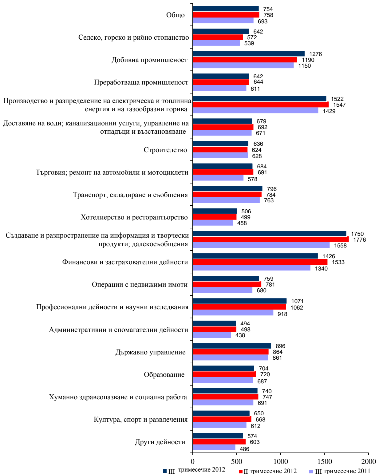
Фиг. 2. Средна месечна работна заплата по икономически дейности - левове

регистрирано най-голямо намаление на средната месечна работна заплата, са „Финансови и застрахователни дейности”- със 7.0%, „Други дейности” - с 4.8%, и „Операции с недвижими имоти” - с 2.8%. Дейностите с най-голямо увеличение на средната месечна заплата са „Селско, горско и рибно стопанство” - с 12.2%, и „Добивна промишленост” - със 7.2%.