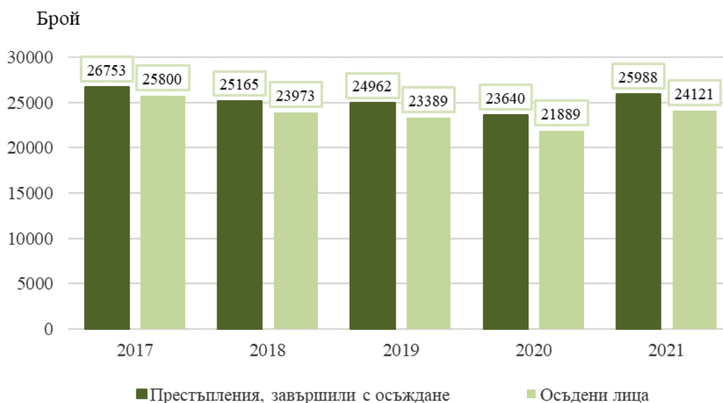
Фиг. 1. Престъпления, завършили с осъждане, и осъдени лица през периода 2017 - 2021 година

Броят на осъдените лица с влезли в сила присъди през 2021 г. е 24 121, което е с 10.2% повече в сравнение с 2020 година. Осъдените непълнолетни лица (14 - 17 години) са 963, или 4.0% от всички осъдени.