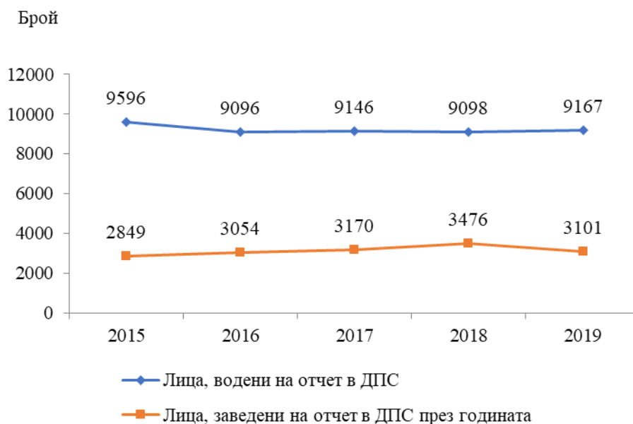
Фиг. 1. Малолетни и непълнолетни лица, водени и заведени на отчет в ДПС през периода 2015 - 2019 година