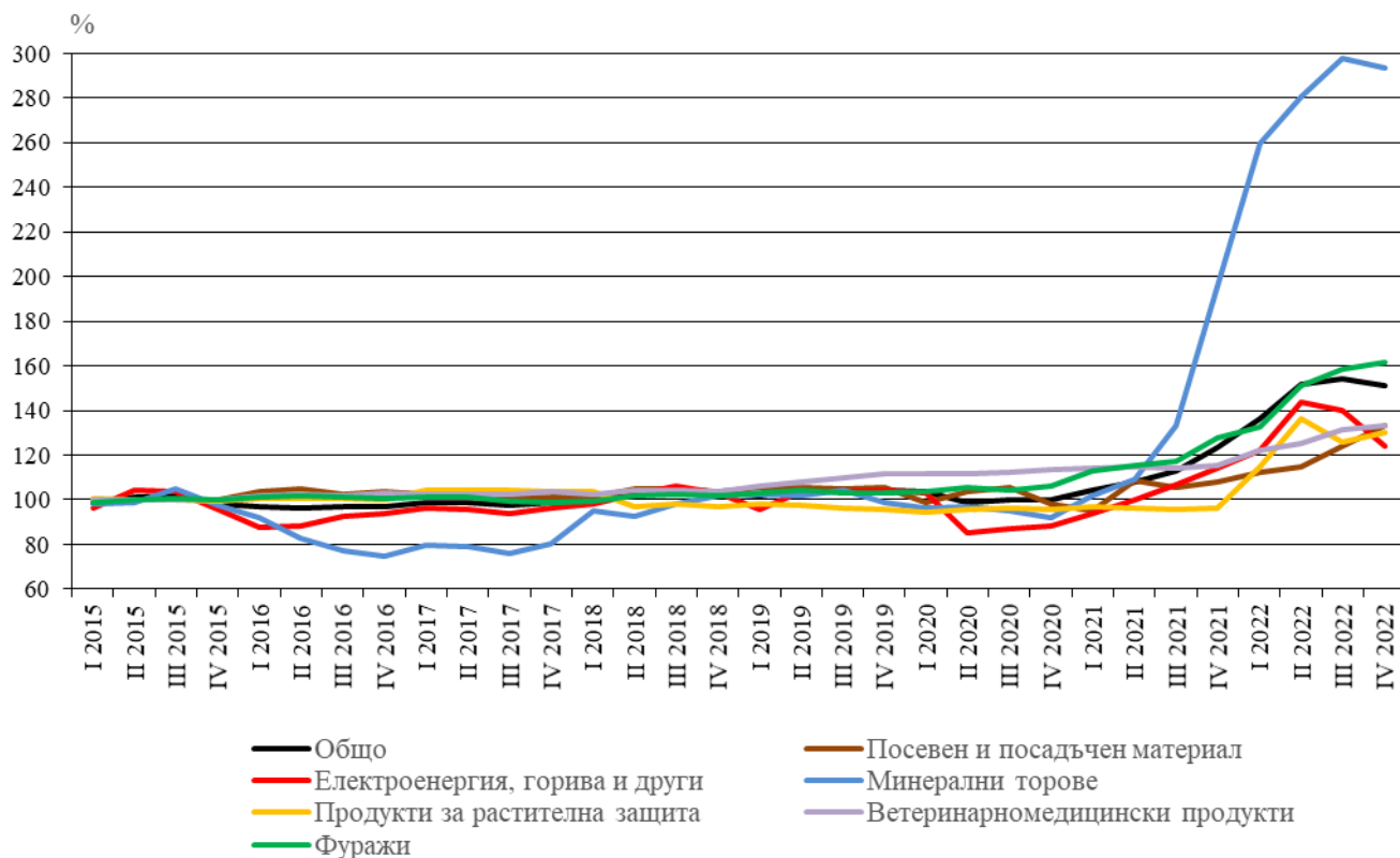
Фиг. 2. Индекси на цените на продуктите и услугите за текущо потребление в селското стопанство по тримесечия (2015 = 100)